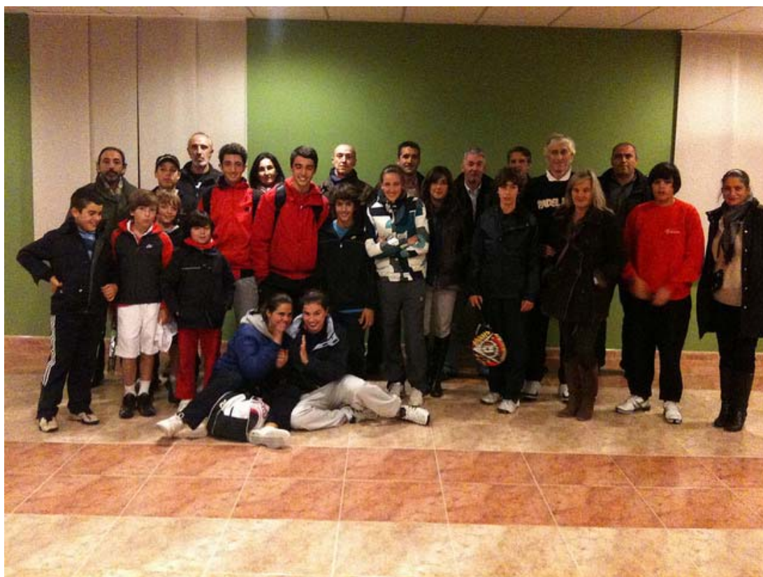
Grupo de padres e hijos una vez finalizados los test